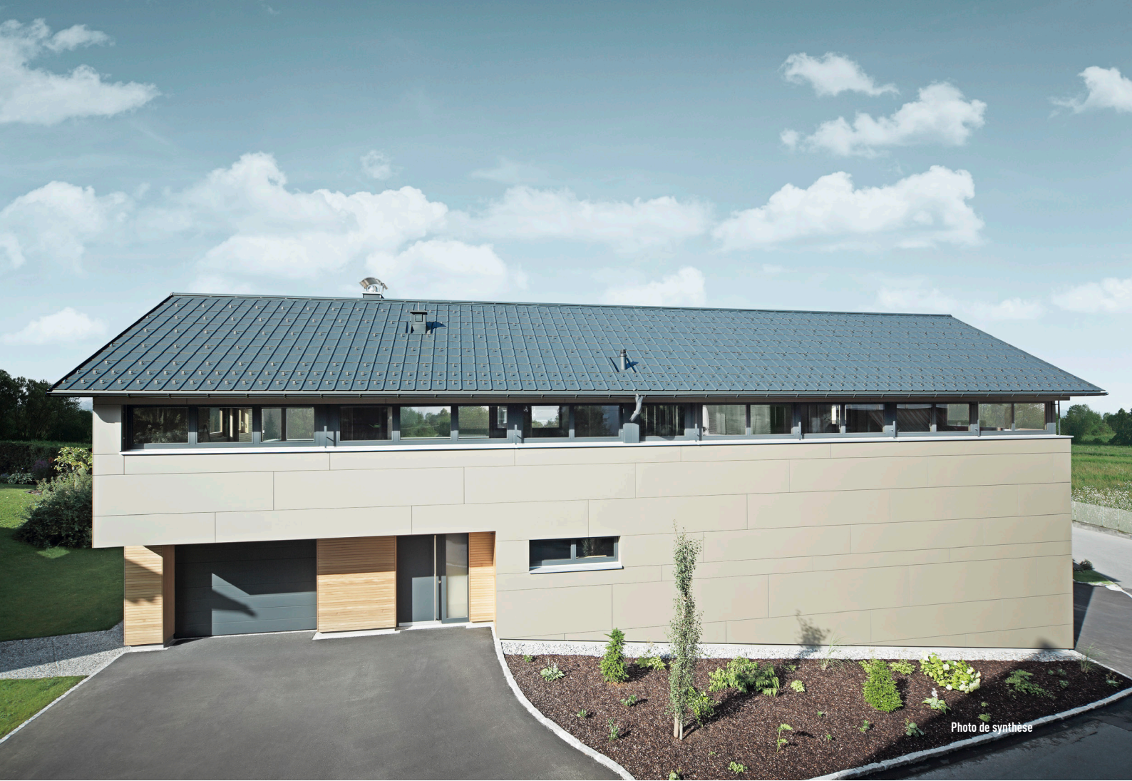
Photo de synthèse

ROBUSTE COMME UN TAUREAU TOITURES • FAÇADES • SOLAIRE